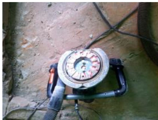
Esempi di demolizione di intonaco