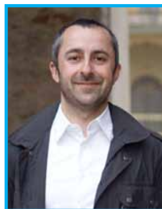
caso da studiare.

pa che ci opprime. Quella che abbiamo accettato di condividere è una scommessa. Una scommessa che come tale comporta una certa dose di rischio: circa la capacità del proponente di riuscire a far fronte agli impegni presi da un lato e dall'altro la possibilità di veder trasformate in opportunità tutte le perplessità sopra esposte. Abbiamo fatto un primo passo, altri ne occorrono. La crisi tarpa le ali a tutto, tranne che ai cervelli: gli uomini non hanno smesso di pensare. A Nantes due italiani hanno inventato "le SoNantes" e provano a vincere la crisi senza l'uso dell'euro: un