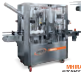
MHIRA AUTOMATICA 1500 bph