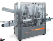
TECH49 AUTOMATICA 1800 bph